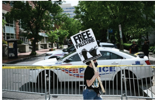
Una joven solitaria se manifiesta a las puertas de la Universidad George Washington, en DC, luego que la policía local desmontó un campamento donde protestaban personas pro-palestinas.

Los agentes permanecieron en el lugar hasta media mañana, cuando aún quedaba un manifestante solitario con un cartel que decía “Palestina Libre”. Las tiendas de campaña fueron retiradas por un camión de basura.