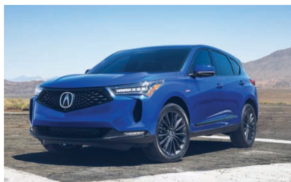
Las ventas de los RDX de Acura -la marca de lujo de Honda- subieron en más del 44% interanual.

culos eléctricos de Honda excedieron las 21,000 unidades, donde los CR-V Hybrid y Accord Hybrid logran el 46% y el 51% de la combinación de ambos modelos, respectivamente