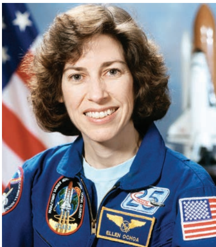
La astronauta Ellen Ochoa (izquierda) y la presidenta nacional del sindicato nacional United Farm Workers (UAW), recibieron la Medalla Presidencial de la Libertad el viernes en la Casa Blanca, de manos del presidente Joe Biden.