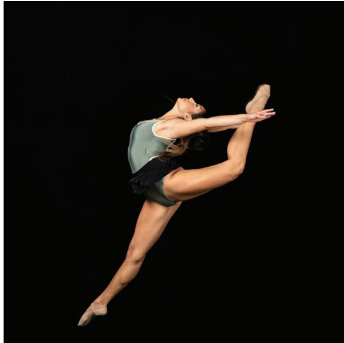
Coreógrafa estadounidense Gianna Skye Sibrián

El Instituto Coreográfico ICONS ofrece un refugio creativo experimental y un programa de desarrollo profesional para coreógrafos emergentes. Durante una residencia de ocho meses en ICONS, los artistas reciben una formación completa antes de obtener