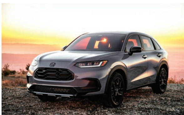
Las ventas en abril del Honda HR-V Sport alcanzaron las 13 mil unidades.

Con respecto a las ventas solo de la marca Honda, estas llegaron a 106,000 uni-