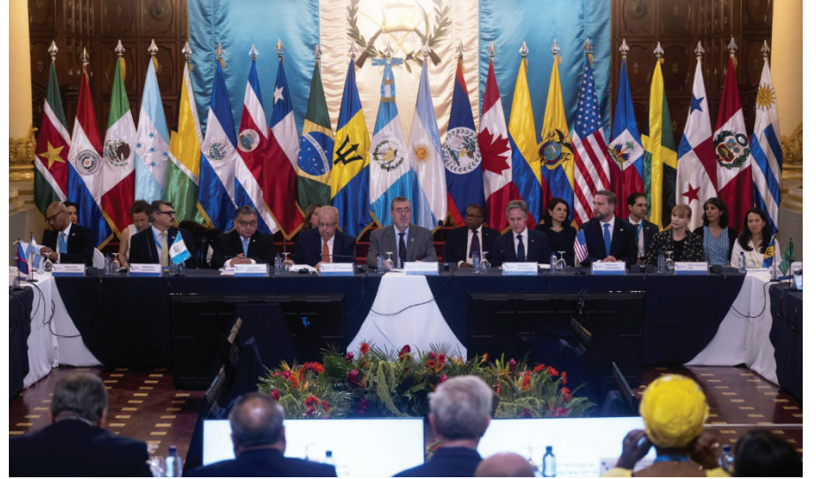
El presidente de Guatemala, Bernardo Arévalo (centro), anfitrión el 7 de mayo de 2024 de la cumbre de ministros y altos funcionarios de países de las Américas signatarios de la Declaración sobre Migración y Protección suscrita en 2022 en Los Ángeles.

Blinken destacó que el lunes Washington anunció “restricciones de visas a ejecutivos de empresas colombianas de migración marítima que están