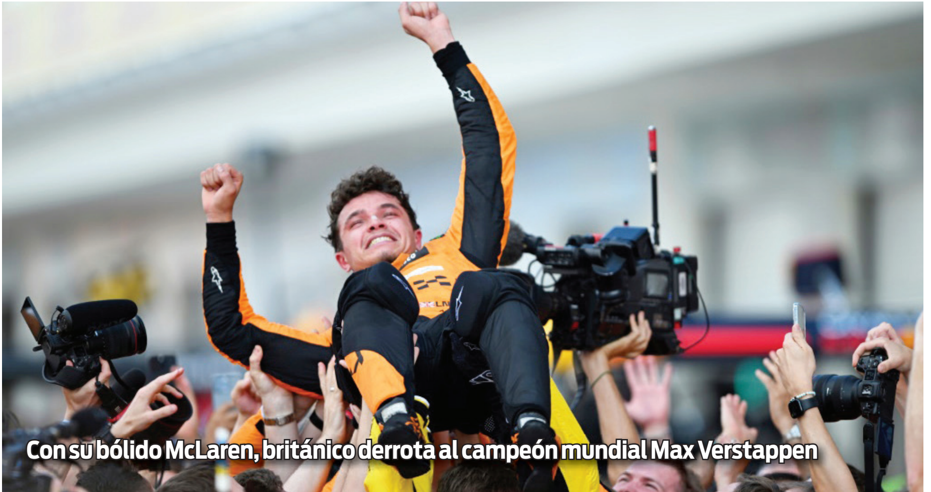
Con su bolido McLaren, británico derrota al campeón mundial Max Verstappen