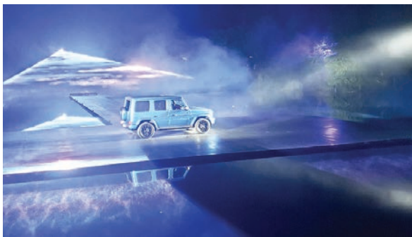
Aquí el impresionante debut del Mercedes-Benz Clase G con tecnología EQ en Los Ángeles. El parque Franklin Canyon se convirtió en el escenario perfecto para esta ceremonia.

La inconfundible silueta del G-Wagen lo ha conver-