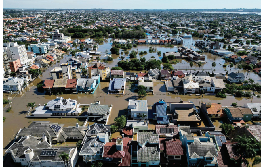
Vista aérea de Canoas, al norte de Porto Alegre, Brasil, el martes 7 de mayo, afectada por las severas inundaciones que han causado más de cien muertes en el sur del país.

Pero cuando el agua apenas bajaba en algunas zonas de Porto Alegre y su zona metropolitana, la lluvia volvió a caer, lo que inte-