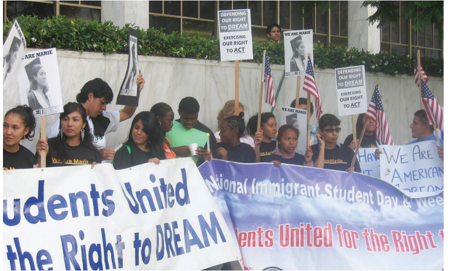
Años de movilizaciones y luchas pidiendo acceso a la residencia permanente y la ciudadanía han desarrollado los dreamers y las organizaciones de defensa de los inmigrantes. Sus objetivos siguen avanzando, como el obtenido el viernes con la extensión de los beneficios de Obamacare para ellos.