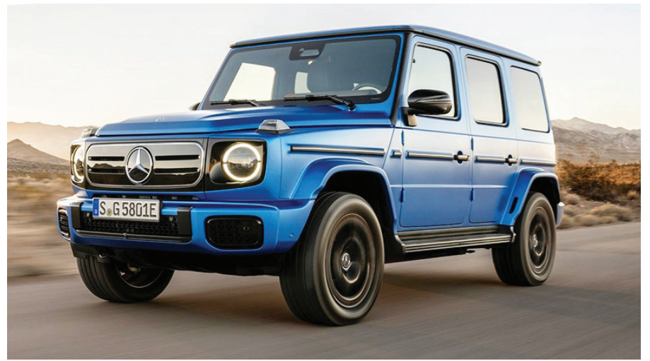
Mercedes Benz G-580 eléctrico , encontró gran acogida en su presentación mundial en Los Ángeles. El nuevo modelo eléctrico de la marca, con tecnología EQ, es una auténtica leyenda.

Al evento exclusivo donde se reveló el Mercedes Benz G-580 eléctrico en Los Ángeles asistieron celebridades de las industrias de la música, la moda, el cine y la cultura. Entre ellos destacaron, Trevor Noah, Bradley Cooper, el piloto de Fórmula 1 George