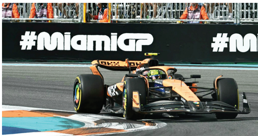
El mejorado bólido McLaren del joven piloto británico Lando Norris demostró su potencia y velocidad durante el Gran Premio de Miami del domingo 5.

■ Norris es un excelente comunicador con amplia presencia en redes sociales, donde tiene ocho millones de seguidores en Instagram.