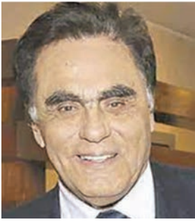
LUIS GONZALES POSADA

Se han cumplido cinco años del sensible fallecimiento del presidente Alan García, víctima de un sistemático y cruel acoso que involucró a jueces, fiscales, medios de prensa y al corrupto Martín Vizcarra.