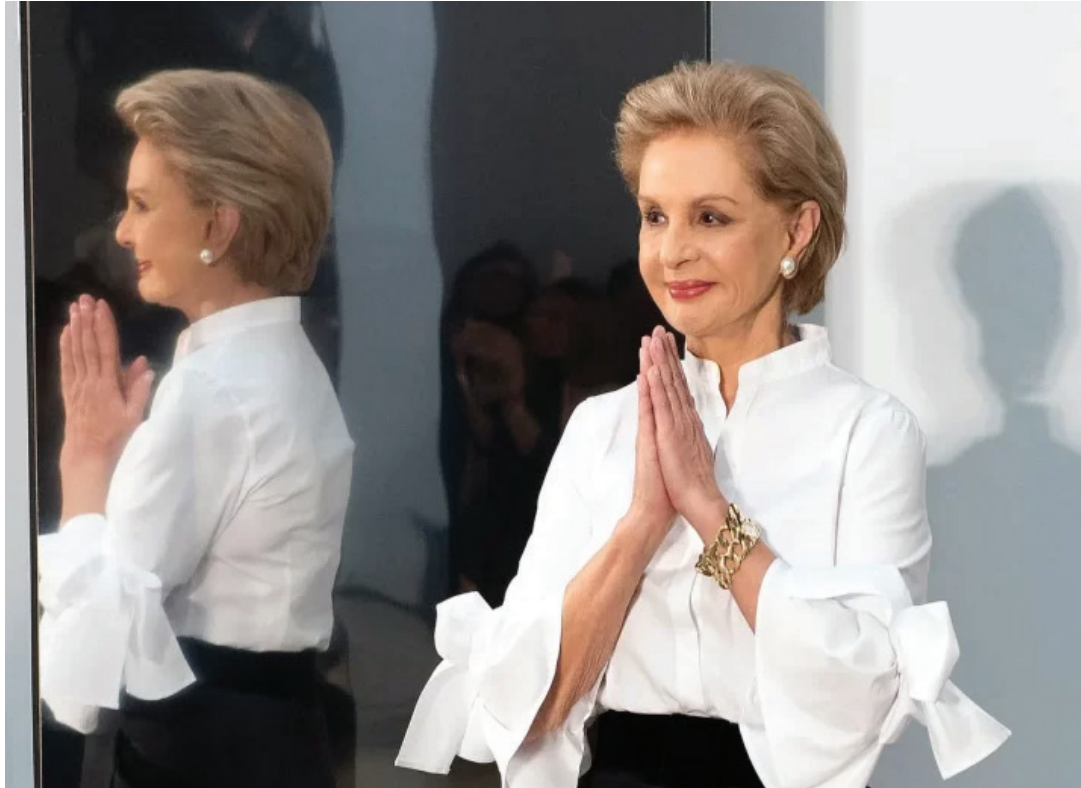
Carolina Herrera, premio a la Herencia Hispana 2024

La Fundación de la Herencia Hispana (HHF) es una organización sin fines de lucro que tiene como objetivo promover la educación, la fuerza laboral, el impacto social, justicia y cultura de la comunidad his-