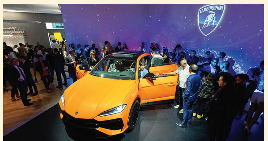
El SUV híbrido Lamborghini Urus SE tuvo su debut en un selecto evento privado en Nueva York.

Este conjunto es suficiente para catapultar el vehículo de 0 a 62 mph en solo 3,4 segundos (Urus S: 3,5), logrando una velocidad máxima de 194 mph (Urus S: 190 mph). El motor eléctrico síncrono de imanes permanentes se encuentra montado en la transmisión automática de 8 velocidades y es capaz de potenciar, tanto el motor V8 como actuar como tracción eléctrica, lo que convierte al Urus SE en un vehículo con tracción